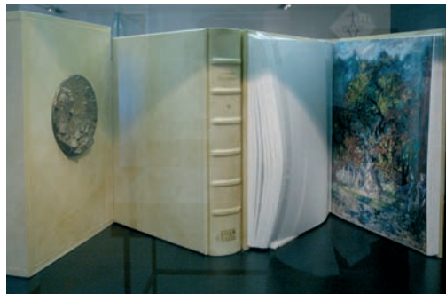
Eine der zahlreichen, wunderschönen Dante-Ausgaben