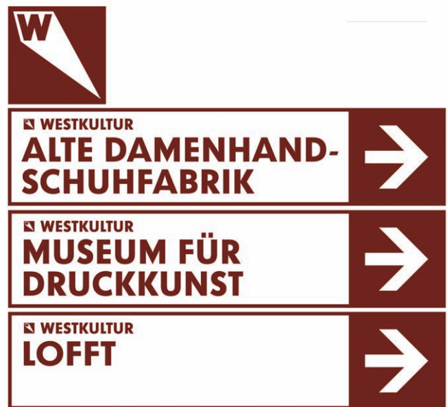
Kulturleitsystem Leipziger Westen (Entwurf) © dataholic

Auf der Webseite www.druckkunst-museum.de > Sammlung > Schriften sind weitere Informationen zur Kristall Grotesk sowie eine Übersicht zu den sieben Schnitten dieser digitalisierten Schrift zu finden.