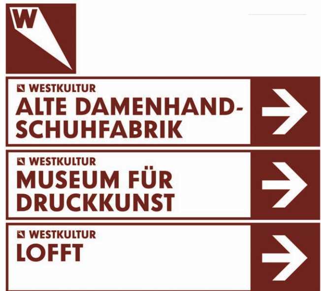
Kulturleitsystem Leipziger Westen (Entwurf)

Auf der Webseite www.druckkunst-museum.de > Sammlung > Schriften sind weitere Informationen zur Kristall Grotesk sowie eine Übersicht zu den sieben Schnitten dieser digitalisierten Schrift zu finden.