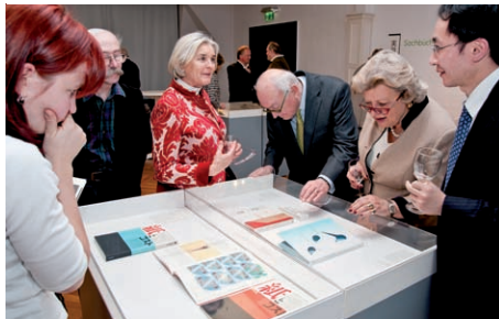
Mehr als 150 Gäste bei der Ausstellungseröffnung am 11. Februar 2011

Zur Buchmesse am 18. März wird in der Ausstellung ein literarischer Abend mit der in Berlin lebenden Autorin Yôko Tawada unter dem Motto »Das Leipzig des Lichts und der Gelatine« stattfinden.