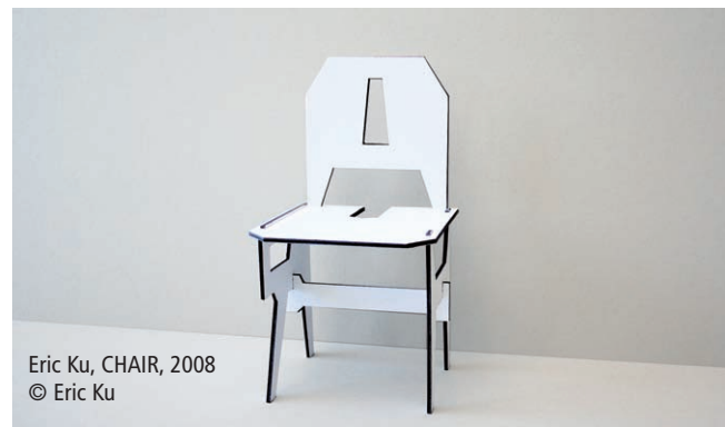
Eric Ku, CHAIR, 2008 © Eric Ku