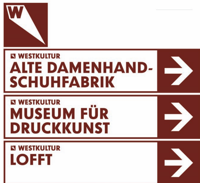
Kulturleitsystem Leipziger Westen (Entwurf) © dataholic

Auf der Webseite www.druckkunst-museum.de > Sammlung > Schriften sind weitere Informationen zur Kristall Grotesk sowie eine Übersicht zu den sieben Schnitten dieser digitalisierten Schrift zu finden.