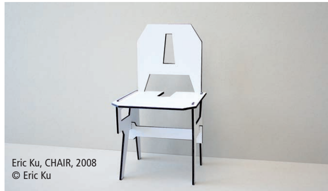
Eric Ku, CHAIR, 2008 © Eric Ku