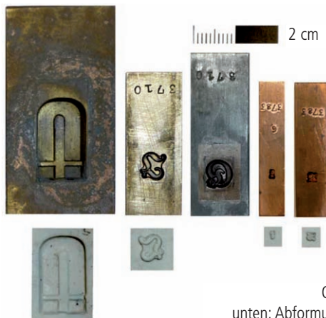
Oben: Schriftmatrizen, unten: Abformungen in Silikonmasse

Dr. G. Klöß zur Verfügung gestellt wurde, zu schaffen, denn hier konnten zwar kleine Buchstaben, die größeren aber nur ausschnittsweise erfasst werden. Umgangen wurde das Problem mit einer Abformung des Originals mit elastomerer Silikonmasse, von der dann mit dem Digitalmikroskop dreizehn 2D-Bilder aufgenommen wurden, die durch Überlagerung ein 3D-Bild mit klaren Konturen ergaben. Beide Wege sind durchaus aufwändig, könnten aber bei kleinen und großen Buchstaben den klassischen Schriftguss mit Blei ersetzen, um qualitativ gute Vorlagen für die Erfassung des Matrizenfundus des Museums zu erhalten. Bei der weiteren Erfassung und Erforschung der Matrzensammlung wird das Museum sicher wieder auf die Expertise von Prof. Dr. Klaus Bente und seinem Team an der Universität Leipzig zurückkommen.