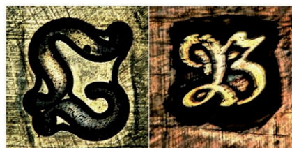
2D-Bilder von stark reflektierenden Matrizen aus Messing oder Kupfer